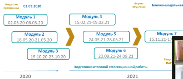
График и форма обучения